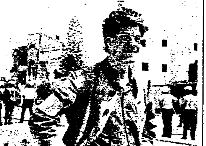
ممثل للامم المتحدة يرافقه نظيره احتجاج على مقتل العامل الفلسطيني قبل ٤ ايام (رويترز)

اخرى في مؤتمر صحفي عن قلقه العميق لسقوط قتل في المناطق المحتلة وكان وزير الخارجية الاميركي جيس بوش قد اثار غضبا من الفصيح الاسرائيلي بقوله ان الاراضي المحتلة والولايات المتحدة مستعدة لبحث فكرة ايفاد فريق من مراقبي الامم المتحدة الى المناطق المحتلة اذا طرحت هذه الفكرة في اجتماع مجلس الامن في اليوم. وقال الرئيس بوش في مؤتمره الصحفي انه يشعر بالقلق لسقوط قتل في المنطقة واضاف قوله اشعر بالفزع عني واقهر بصفة خاصة في الاطلاق في مثل هذا الموقف. واغرب الرئيس جورج بوش مرة